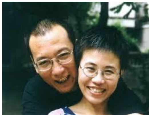
Liu Xia & Liu Xiaobo

Liu Xia (k) Lyrikeren og billedkunstneren Liu Xia, f. 1. april 1961, er blevet holdt i streng husarrest siden 2010, da hendes mand, modtageren af Nobels fredspris Liu Xiaobo, blev idømt elleve års fængsel af de kinesiske myndigheder. Hun er ikke anklaget for nogen forbrydelse, men hendes lejlighed er under konstant overvågning, hendes adgang til alle medier er spærret, og hendes venner har ingen mulighed for at få kontakt med hende. Liu Xi's sjældne besøg hos sin fængslede mand er ligeledes overvågede. Hun kan ikke fortælle ham nyheder eller aflevere breve til ham. Hendes helbred er under isolationen blevet meget skrøbeligt, og hun lider af stærke depressioner.